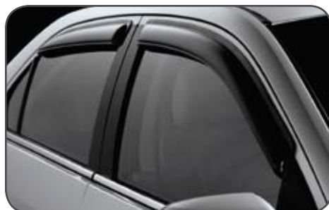
Défecteurs de glaces latérales