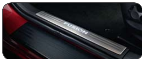
Enjoliveurs de seuil de porte éclairés à l'avant

PEP Protection étendue Ford. Selon le type de PEP sélectionné, certains accessoires d'origine Ford installés par le concessionnaire peuvent être couverts pour une période allant jusqu'à 7 ans ou 150 000 kilomètres. Consultez votre concessionnaire Ford Canada pour plus de précisions.