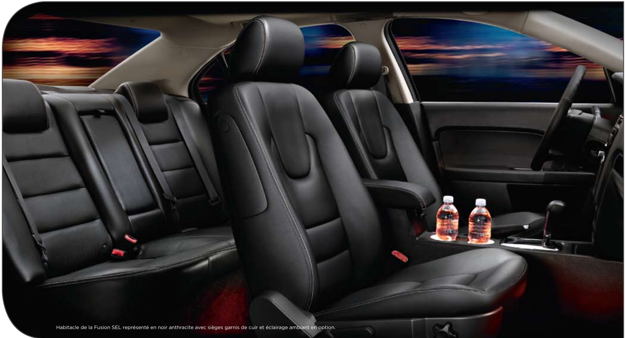
Habitacle de la Fusion SEL représenté en noir anthracite avec sièges garnis de cuir et éclairage ambiant en option.

Peu importe votre longue liste de choses à faire