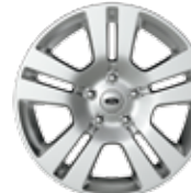
De 17 po en aluminium usiné De série pour SEL