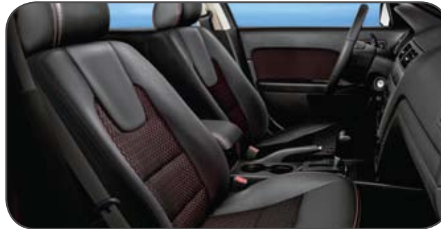
Habitacle avec ensemble décor sport et empiècements des sièges en tissu.

1 Bouclez toujours votre ceinture de sécurité et assurez-vous que les enfants sont bien attachés à l'arrière.