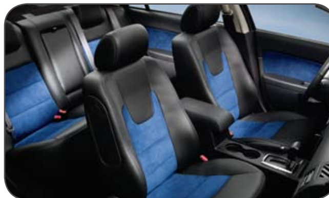
Habitacle avec ensemble suède bleu.