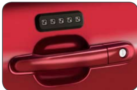
Clavier d'entrée sans clé

1 Accessoires Ford autorisés sous licence. Garmin est une marque déposée de Garmin Ltd.