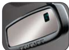
Rétroviseur à électrochrome avec HomeLink®