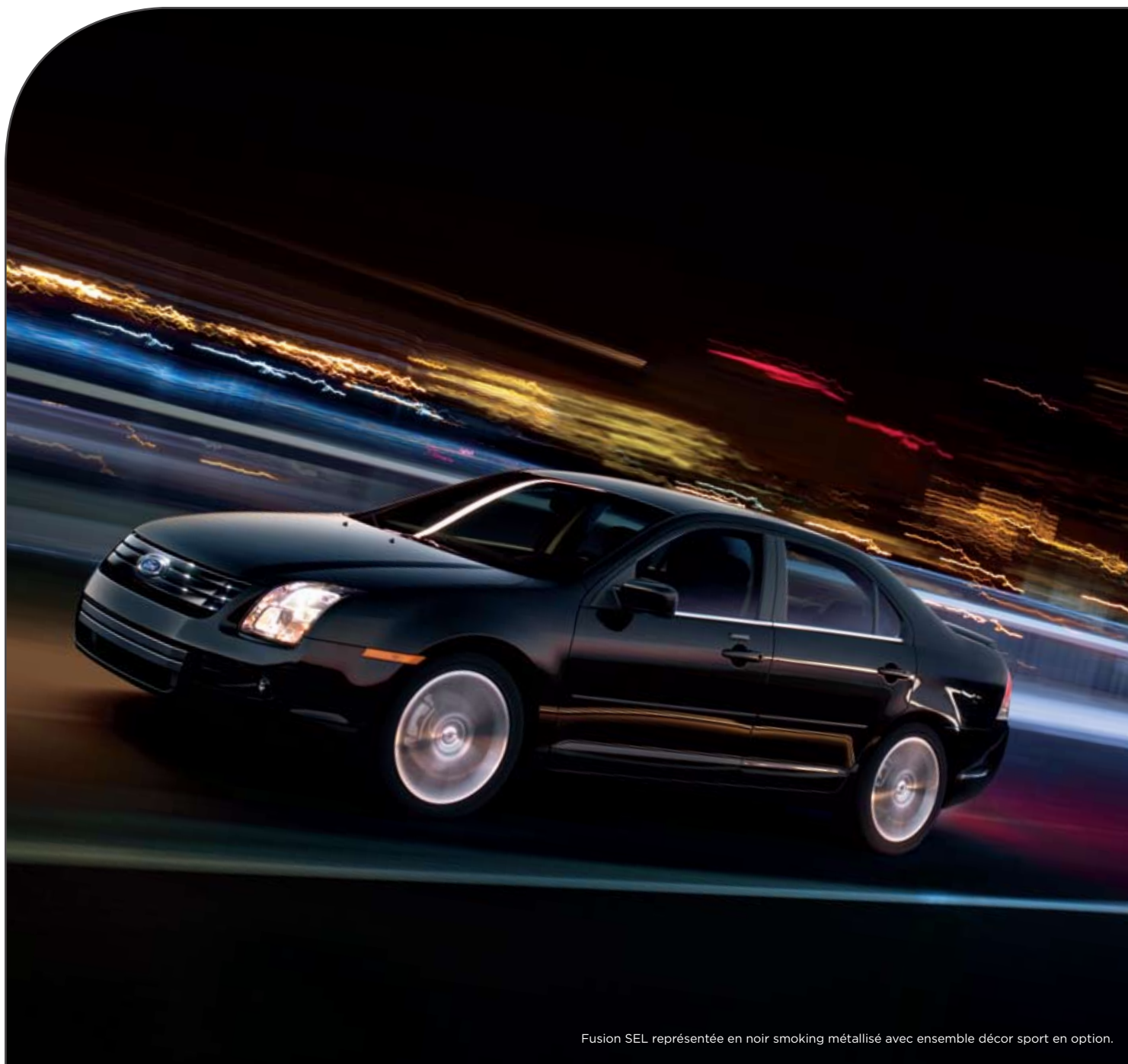
Fusion SEL représentée en noir smoking métallisé avec ensemble décor sport en option.

La Fusion offre en option un ensemble décor sport tout à fait exceptionnel. Parmi ses raffinements intérieurs : un enjoliveur de chaîne audio en aluminium brossé et des sièges noir anthracite avec empiècements en tissu rouge ou gris joliment ornés de piqûres contrastantes, lesquelles parent même le volant et la console centrale. Témoignage éloquent du soin du détail sous toutes ses coutures. Également comprises dans cet ensemble, la calandre en chrome noir et les jantes de 18 po en aluminium avec alvéoles peintes conférant encore plus de panache à sa silhouette.