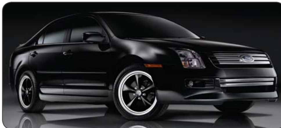
Ensemble de carrosserie (5 pièces) 1