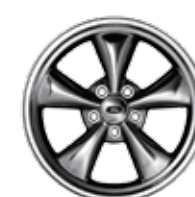
De 17 po en aluminium poli Accessoire d'origine Ford