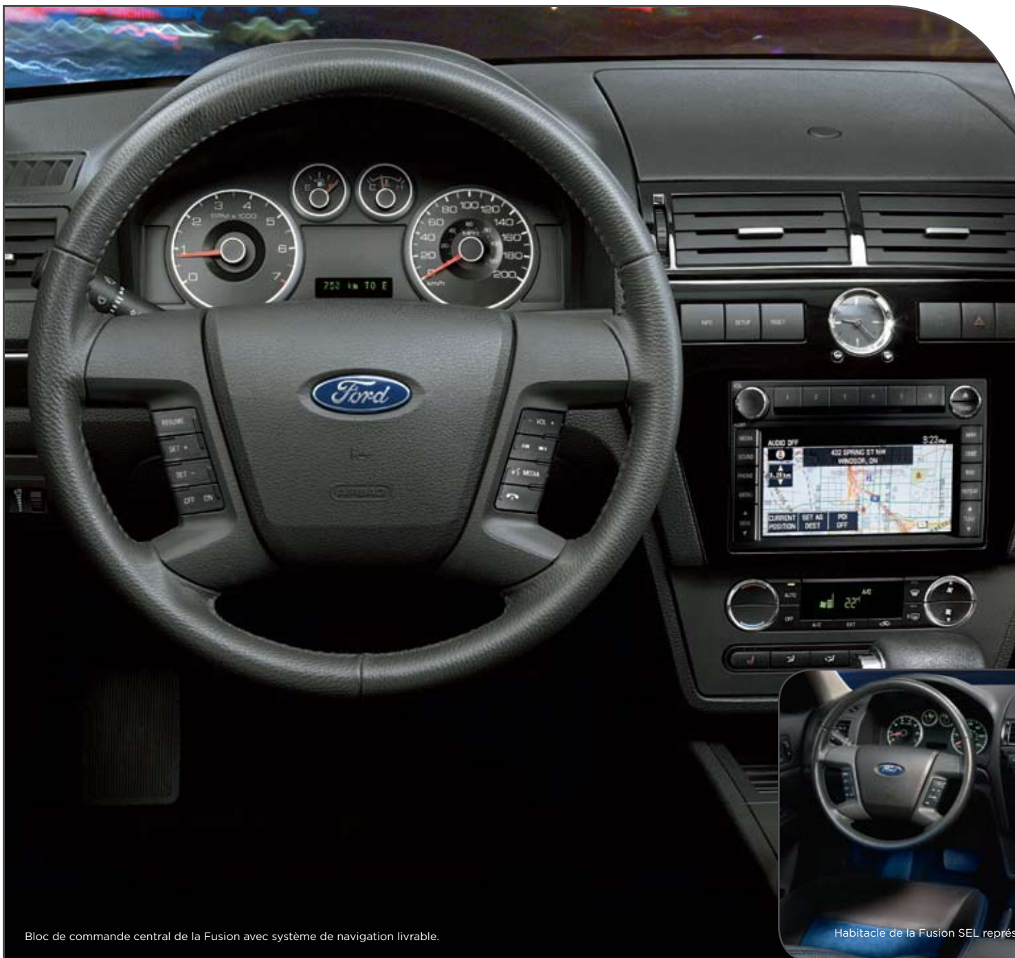
Bloc de commande central de la Fusion avec système de navigation livrable.