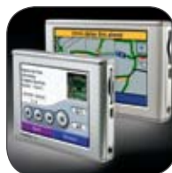
Système de navigation portatif Garmin® nūvi® 1