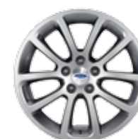
De 18 po en aluminium peint Incluses avec ensemble suède bleu