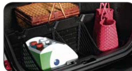
Casier de rangement intérieur