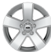
De 16 po en aluminium peint En option pour SE I4