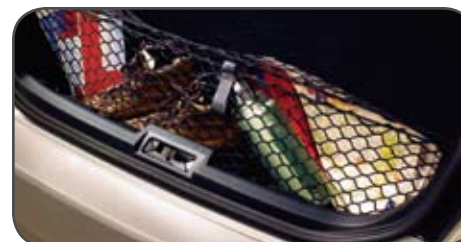
Filet de retenue d'aire de chargement