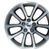
De 18 po en aluminium avec alvéoles peintes Incluses avec ensemble décor sport