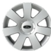
De 16 po en acier avec enjoliveur de luxe De série pour SE I4