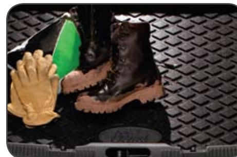
Protecteur d'aire de chargement