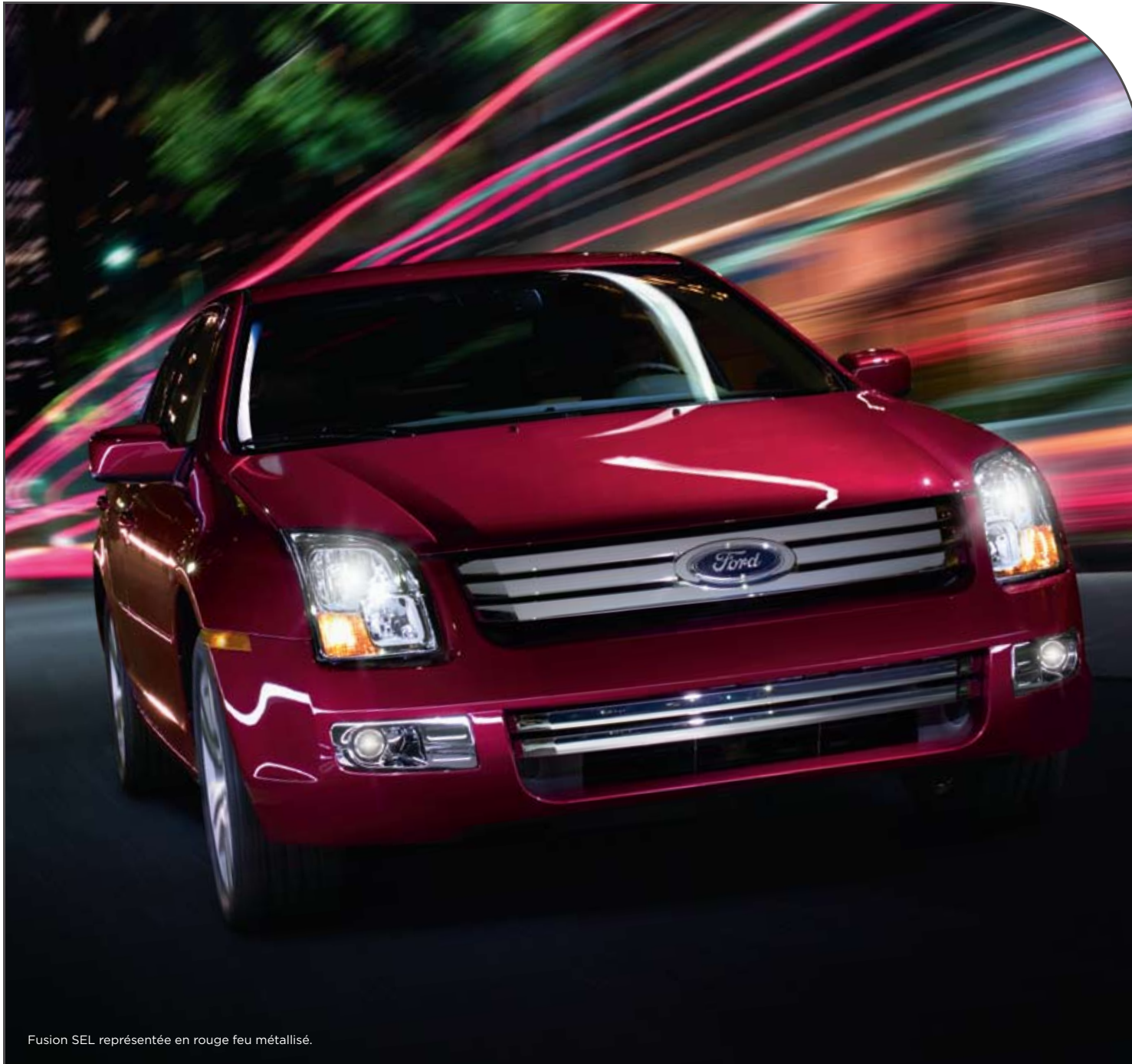
Fusion SEL représentée en rouge feu métallisé.